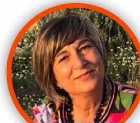
GIOVANNA MARIA BURRELLI SCUOLA PRIMARIA